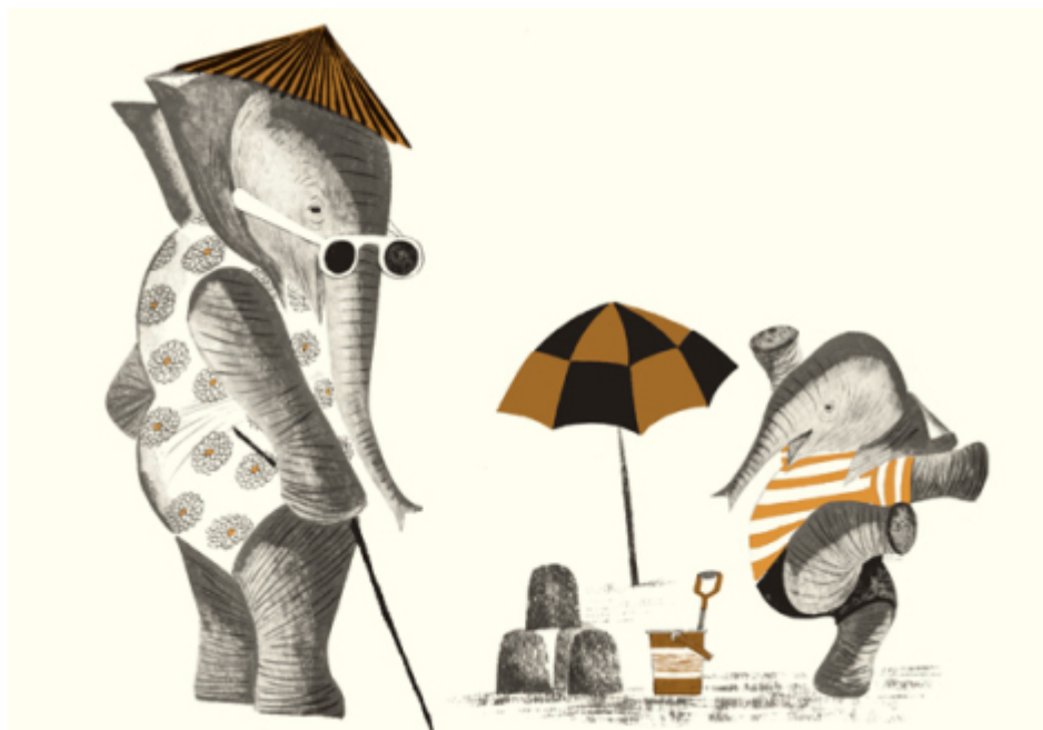
Piccolo elefante va in Cina , Sesyle Joslin, Leonard Weisgard – 2016 Orecchio Acerbo

I testi sono di Sesyle Joslin, le illustrazioni di Leonard Weisgard, la traduzione di Carla Ghisalberti.