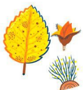
DOPO UNA LUNGA PASSEGGIATA NEL BOSCO, METTO INSIEME I PICCOLI TESORI RACCOLTI LUNGO IL CAMMINO.