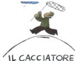
Il cacciatore di nuvole. Età di lettura: dai 4

(http://www.ricominciodaquattro.com/quando-un-elefante-si-innamora-lettura-dai-4-anni/)