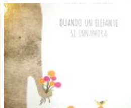
Quando un elefante si innamora. Letture dai 4

(http://www.ricominciodaquattro.com/piccolo-pisello-età-di-lettura-dai-3-anni/)