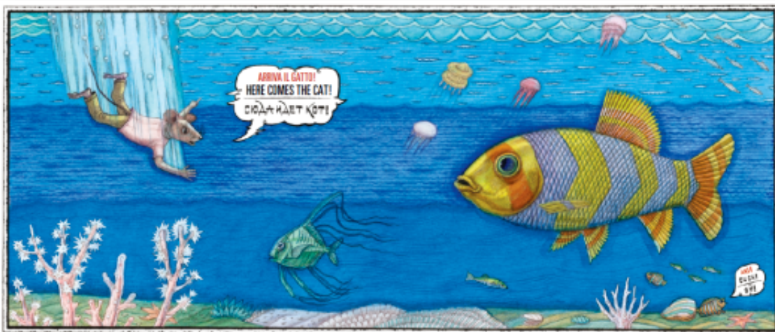
Arriva il gatto di Vladimir Vagin e Frank Asch – Orecchio acerbo 2013

consegue è dunque un topo che non fugge ma aspetta in gruppo, tremante, che il gatto si manifesti (saggio o scriteriato?) e chi s'è visto, s'è visto.