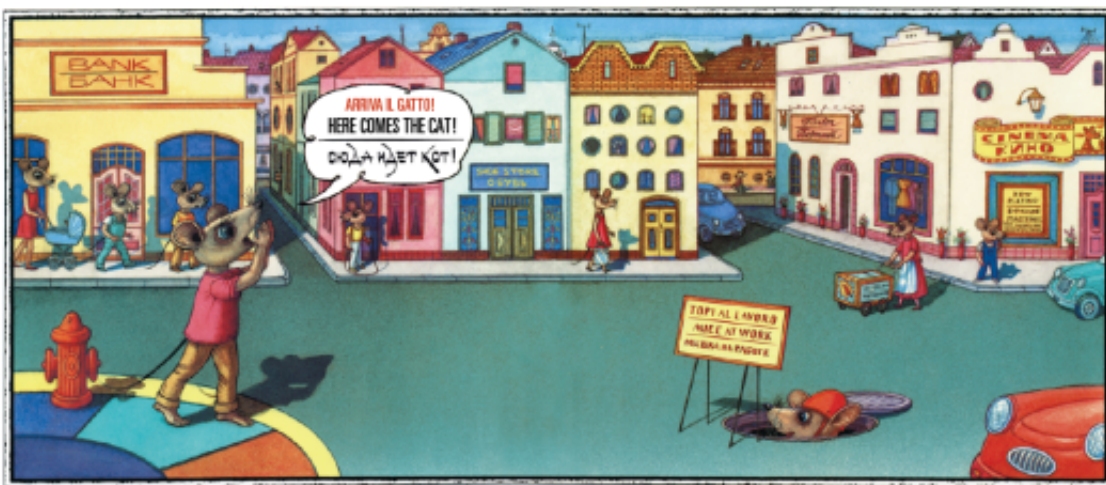
Arriva il gatto di Vladimir Vagin e Frank Asch – Orecchio acerbo 2013

Vladimir Vagin e Frank Asch , russo il primo, americano il secondo, operano una mescolanza similmente eclettica che mostra il desiderio di palesarsi con evidenza ad ogni pagina. Insieme si lavora, in barba alla guerra fredda e ai gatti, insieme ci si organizza in risposta a una sola frase che popola le pagine di questo albo e sulla quale tutta la storia si innesta e svolge: “arriva il gatto!” (in italiano come nelle originali in russo e in inglese).