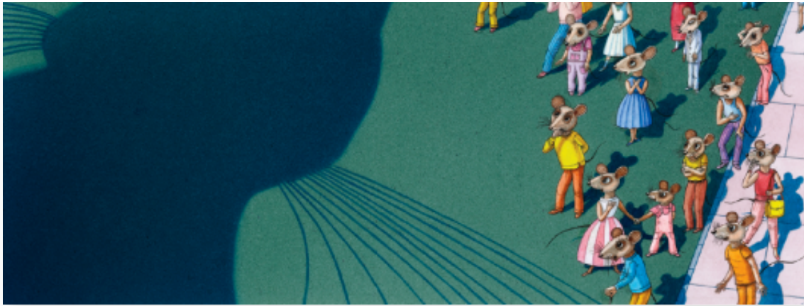
Arriva il gatto di Vladimir Vagin e Frank Asch – Orecchio acerbo 2013

Qual è il finale? Beh... tra un paio di giorni potrete scoprirlo voi stessi in libreria (Arriva il gatto arriverà tra gli scaffali l'11 aprile) e sarà un piacere farlo, un piacere sorprendente dato da un'idea altrettanto singolare e da tavole illustrate dense di colore, cariche di dettagli, movimentate da scie luci e ombre vivificanti.