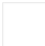
"Piccola orsa" di Jo Weaver