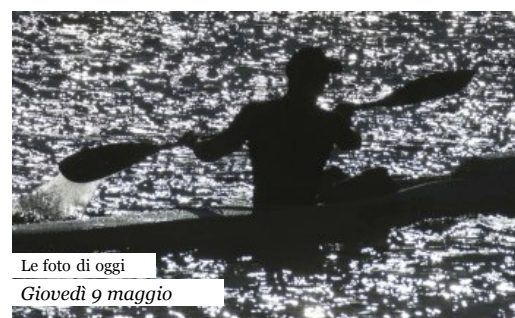
Le foto di oggi Giovedì 9 maggio